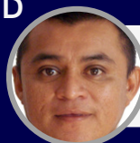
IRVING UC RANCHO