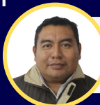
ANGEL UC KOH MAYAN CACAO