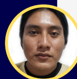
JOSE CUPUL RANCHO